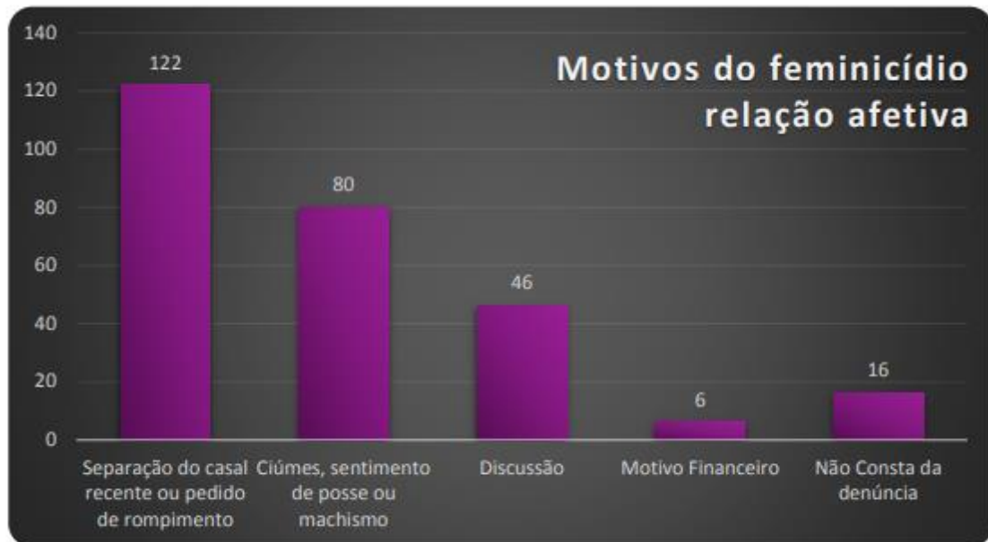
Figura 04 – Principais motivos do feminicídio