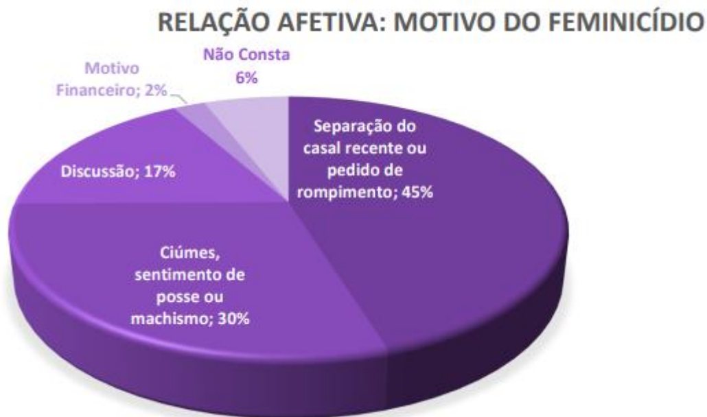
Figura 02 – Principais razões que levam ao feminicídio