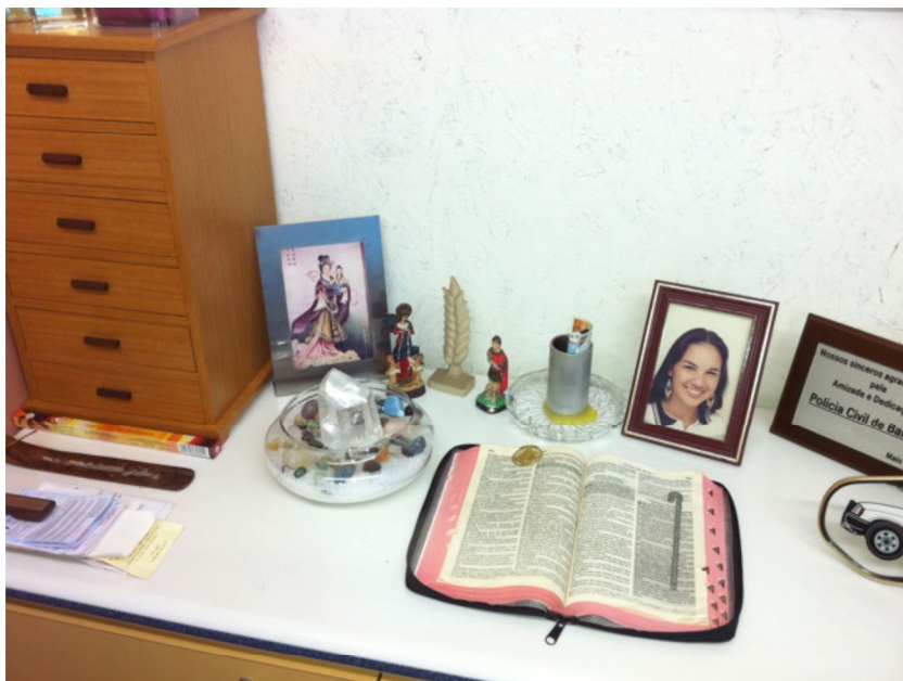
Figura 11: Foto produzida por mim em visita à Syfuentes, no dia da entrevista. Observamos um típico altar “corporativo contemporâneo”, montado com os seguintes elementos: um recipiente de vidro contendo sal grosso e cristais, imagens de santos católicos, fotografia de sua filha, placa de agradecimento da Polícia Civil de Barueri, varetas de incenso e uma Bíblia.