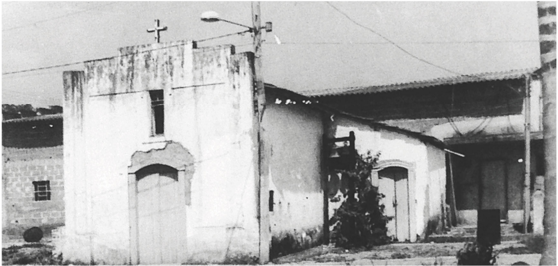
Figura 1: Capela de Nossa Senhora da Escada (1976), época de abandono.