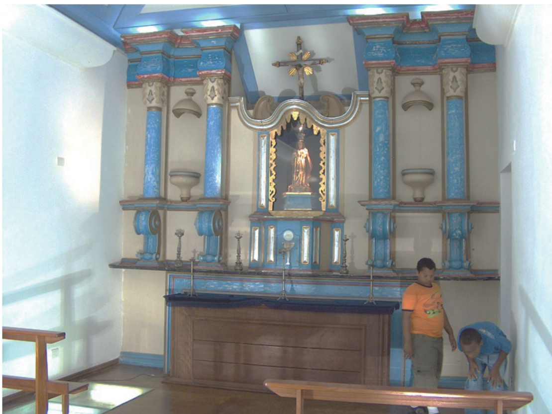
Figura 4: Interior da capela de Nossa Senhora da Escada (2009). (fonte: acervo da Biblioteca Municipal de Barueri, 2014).