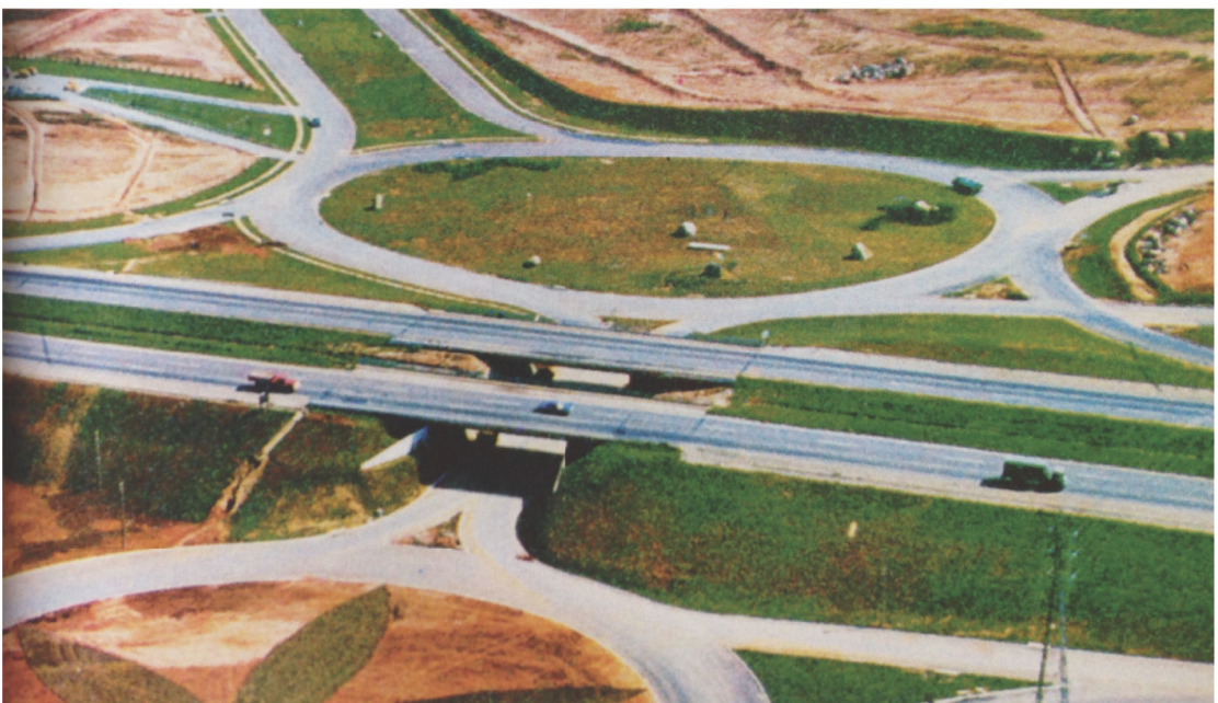
Figura 10: Vista aérea do empreendimento em relação a Rodovia Castelo Branco.