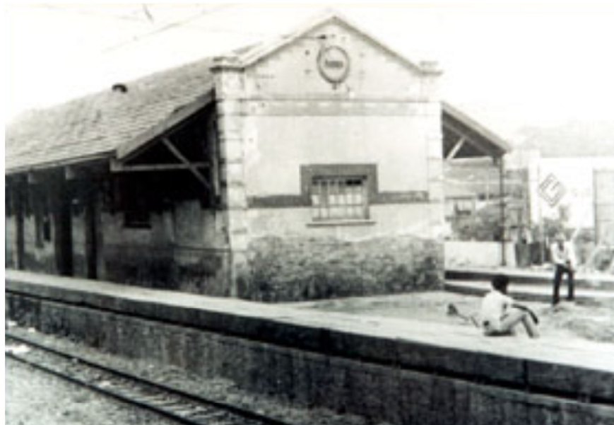
Figura 5: Estação ferroviária de Barueri inaugurada em 1875.

A seguir, foto da estação ferroviária de Barueri inaugurada em 1875.