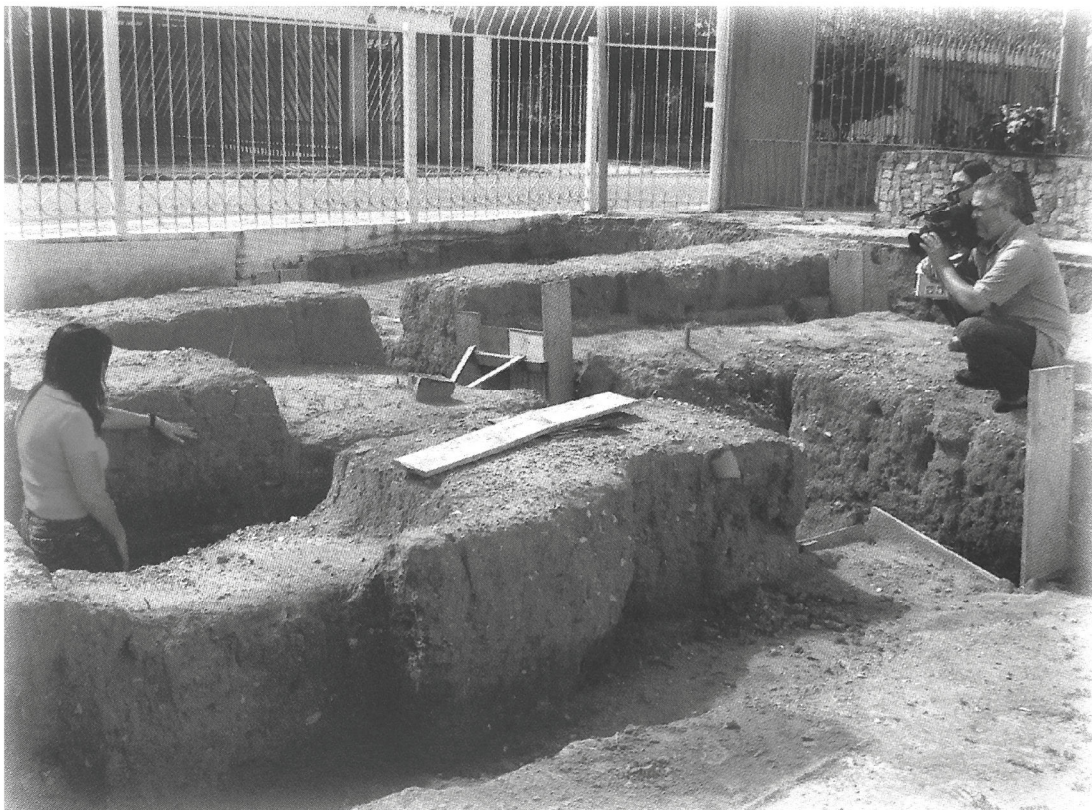
Figura 3: Equipe da USP, durante escavações, em 2007, nas imediações da Capela Nossa Senhora da Escada.