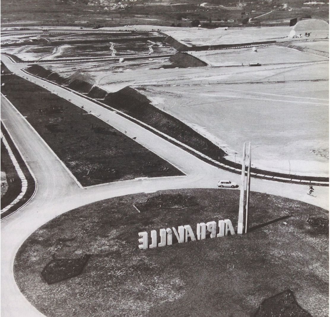
Figura 9: Vista aérea do empreendimento em 1975.