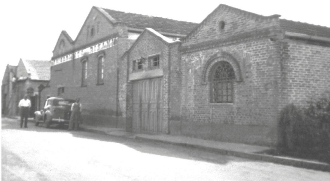
Figura 7: Frigorífico Pisani.

Em 1936, favorecido pelos benefícios fiscais instituídos em Barueri, o Frigorífico Pisani se instalou no município, na avenida D. Pedro II (OLIVEIRA, 2009, p. 16), transformando-se em um marco na história do processo de industrialização da cidade, haja vista o investimento na construção das instalações do Pisani corresponder a 400% do investimento da prefeitura parnaibana, no então distrito de Barueri.